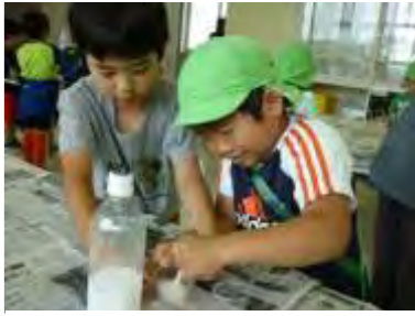
7班 ぶにゅぶにゅスライム