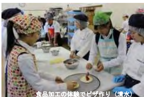
食品加工の体験でピザ作り（清水）

実際に高校の先生や先輩に説明を聞いたり、手ほどきを受けながら溶接や食品加工の実習をしたりすることで、高校の授業の雰囲気を感じることができたようです。