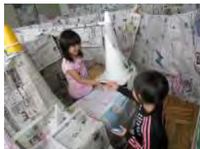
4班 ゴーストラビリンス