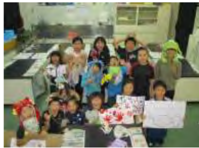
2班 一度入ったら出られない恐怖の理科室