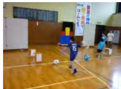
6班 おとすな!ピンポンゲーム