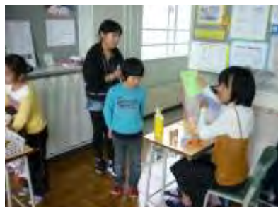
5班 的をねらえ!スナイパーショット