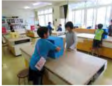
8班 なその箱の中身はなあに