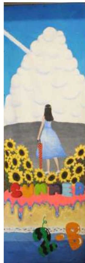
【垂れ幕部門優 2年B組「夏空」】