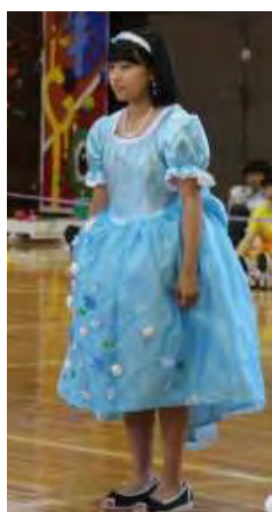
【衣装部門優勝 3年A組 「シンデレラ」】