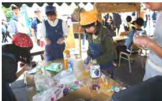
【模擬店部門優勝 3年A組 「インスタカクテル」】