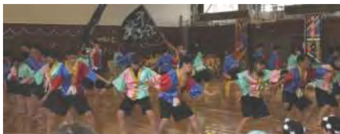
【アトラクション部門優勝 3年B組「よさこい演舞」】

また、一般の来場者は昨年よりも1割以上増え、二百数十名にのぼり、保護者や地域の皆さんとの一体感も得ることができました。ご協力、ご来場いただき誠にありがとうございました。