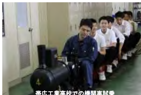
帯広工業高校での機関車試乗