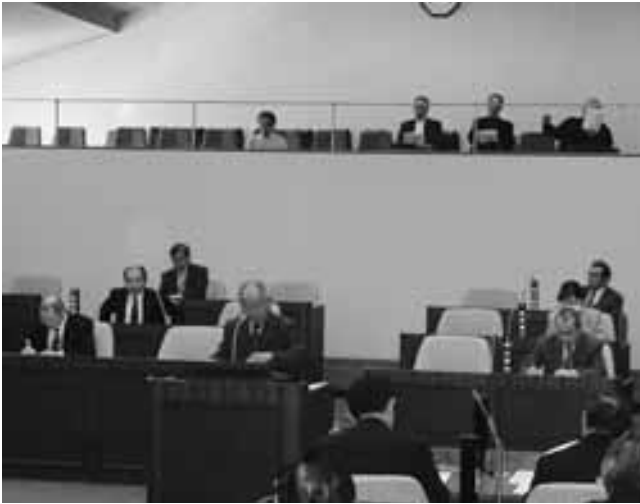
会議規則に新たに2項目が追加され、今後、更なる議会での活発な議論が期待される

■発行 北海道清水町議会 ■編集 清水町議会運営委員会 〒089-0192 上川郡清水町南4条2丁目 ☎62-2111・3317 FAX62-5160