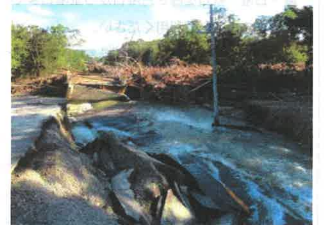
道路の寸断（道道清水大樹線栄橋） ※北海道クラシックゴルフ場入口付近