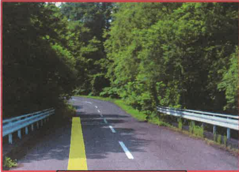
町道清水第3線 小林川