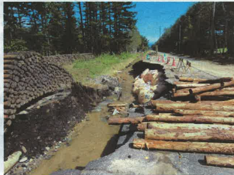
町道羽帯 17 号 十勝千年の森付近