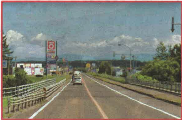
国道 38 号 清見橋