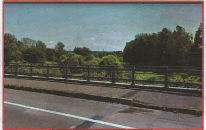
国道 38 号 清見橋