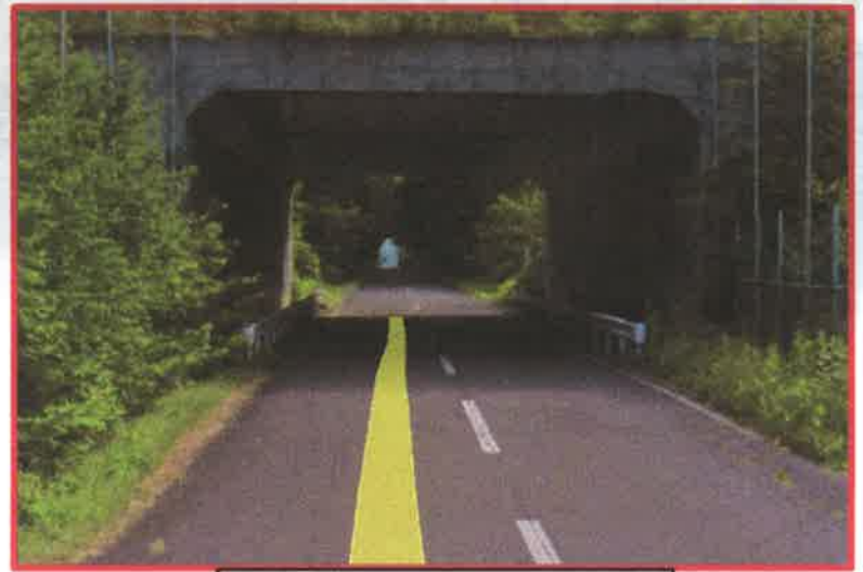
町道清水11号 道東道交差