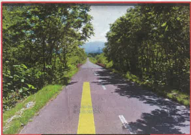
町道御影12号 芽室川