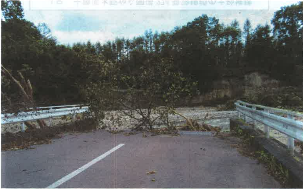
16 十勝道水越や心園掘る34V 谷28種地心十砂補修