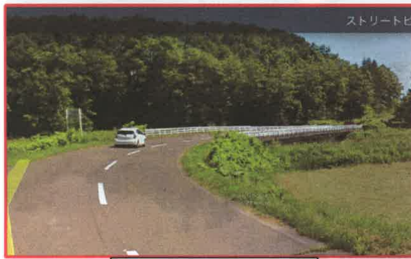
町道御影南6線 芽室川