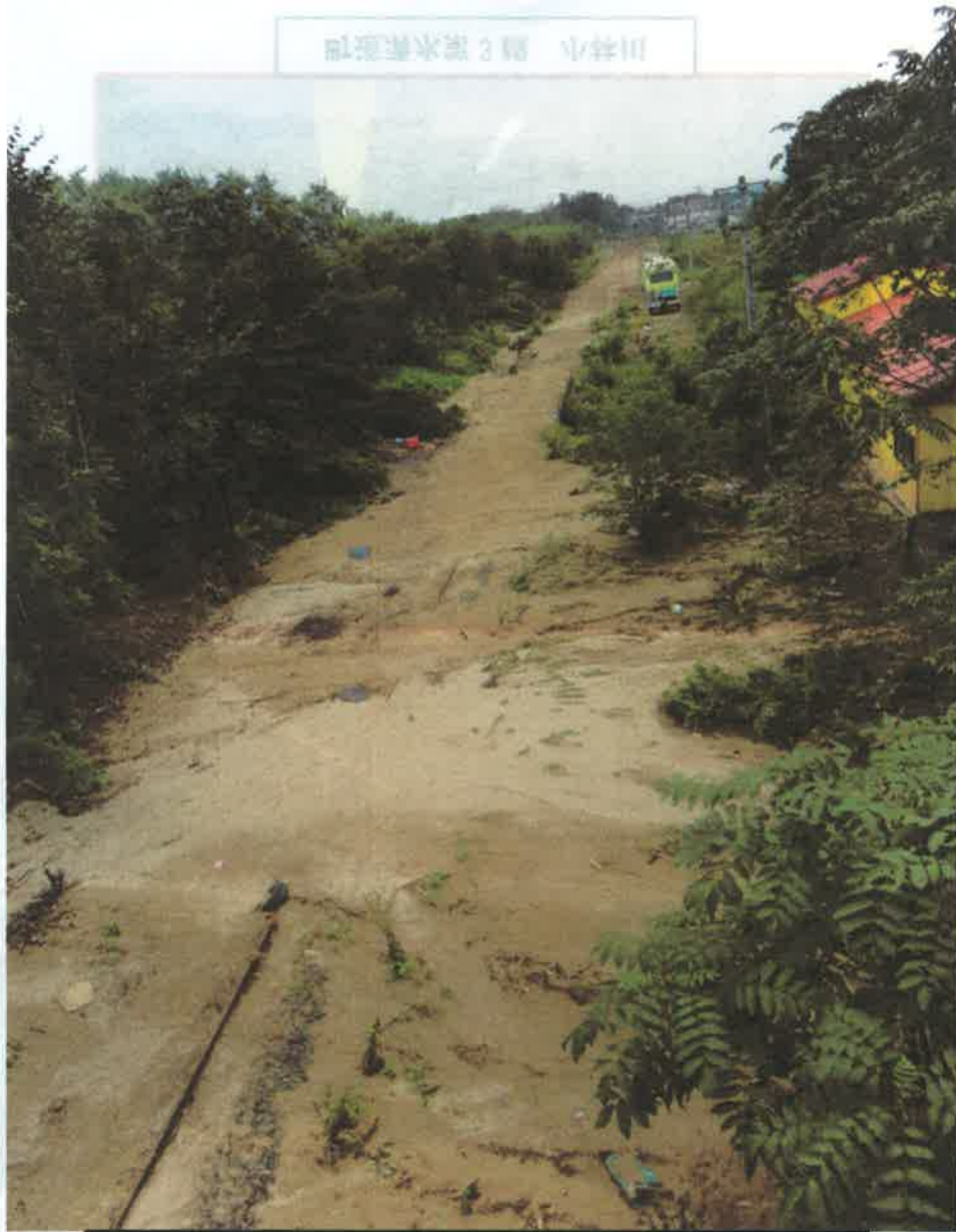
J R 十勝清水駅から国道 274 号跨線橋の土砂堆積