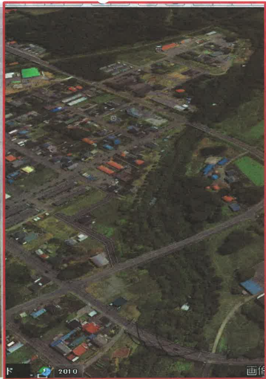
9月1日掲載北海道新聞と被害前の写真比較