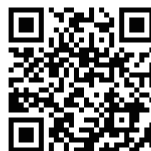
田村議員の一般質問全編