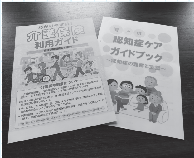
介護保険利用ガイド・認知症ケアガイドブック

くりが必要で、これまでも民生委員自身の担当地区における家庭訪問、町広報紙への名簿掲載で周知に努めてきたが、地域によっては担当の民生委員が住民に認知されていないとの声があり、今後は町内会等からの要望に応じて紹介の機会に対応できるように町民生委員協議会と協議していく。