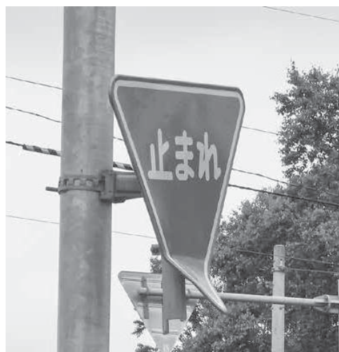
道路標識が見づらくなったら、新得警察署が町民生活課（☎62-1151）へ連絡を

警察署においては、警ら中のパトロールカーや交番の警察官を現場に向かわせて確認し、標識の傾きなどについてはその