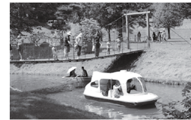
清水公園再整備基本計画策定委 託料も修正の対象に

令和2年第1回定例会は、3月10日から25日までの16日間の会期 で開かれました。 町政執行方針、教育行政執行方針が示され、条例、予算、人事案 件などの議案を審議しました。 審議の結果、令和2年度一般会計予算は修正案可決、副町長人事 は不同意、そのほかの議案は原案のとおり可決しました。