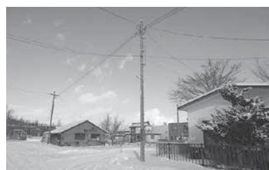
日没が早いと生徒の帰宅が心配に

問 日没後、部活で遅くなった生徒の帰宅する姿が見られるが、安全は確保されているか。