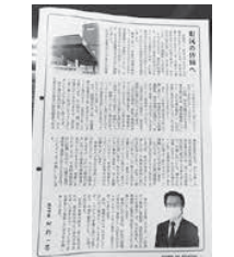
広報しみず12月号の町長からのメッセージ

問 多くの町民を恐怖に陥れた新型コロナウイルス感染症の役場のクラスター（集団感染）発生事案は、恥ずべき事案である。近隣市町村や町内事業所と比べても、職員の健康管理や感染症対策の対処・整備も非常に少なく、危機意識が欠如していたことは明確である。また、11月以降感染症拡大の警戒態勢下においても、毎週のように東京・埼玉などへ出張を繰り返す状況を見て、その危機意識の欠落から、なるべくしてなったクラスターと強く指摘する。町民の安全と安心を守る役割が、現実として崩れ、さらに経済状況も最悪へと導いた責任は重大である。