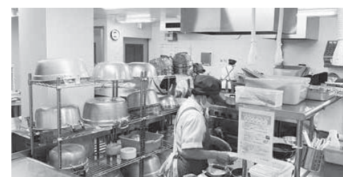
調理作業中のしみず保育所の厨房

問 令和2年4月から始まった保育所等の給食事業の外部委託は、当初より見切り発車的な要素が多々見られ、併せてコロナウイルス感染症の影響から、保護者に対して提供給食の中身の説明もなくこれまで経過している。今後の事業の継続性は是非を含め、給食事業についての考えを伺う。