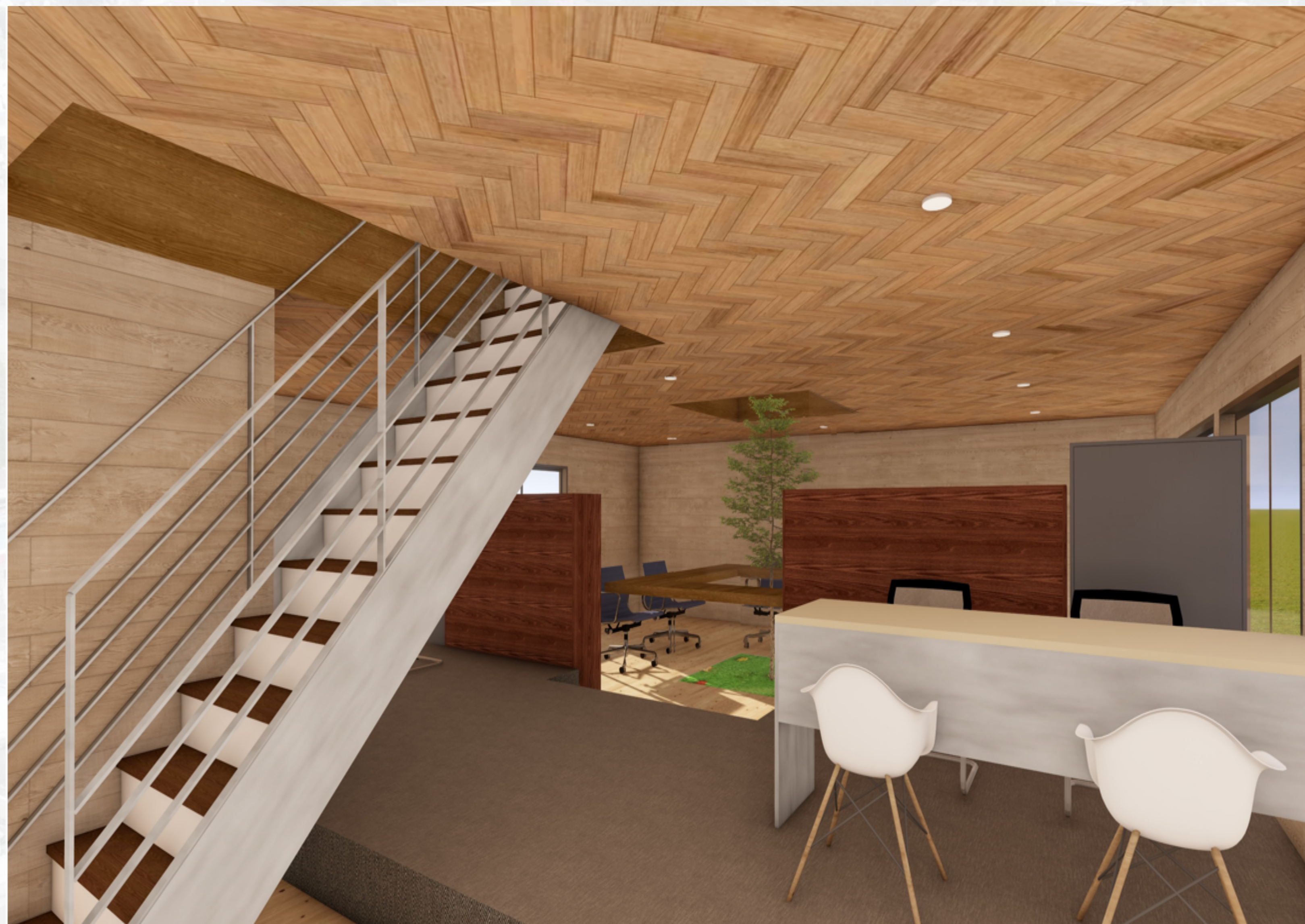
事務所 内観パース

オフィスのような堅苦しく感じる素材を使った空間とはちがい、 住宅のようなあたたかみのある素材を使った空間にしようと考えました。 また、清水町をより身近に感じられるように室内に十勝清水町の 象徴の木であるナナカマドを設計に取り入れました。