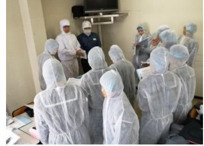
地域にねざした学習 清水学の推進 ・清水ミライ会議 ・清水製糖工場学習 ・プリマハム工場学習