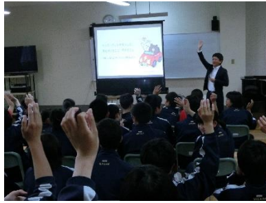
携帯・スマホ教室 トラブル防止について GREE 会社からの説明