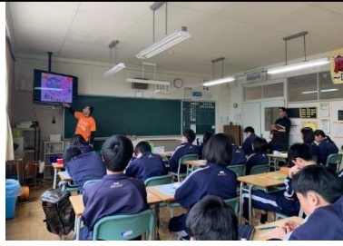
認知症サポーター講義 3年生の学習