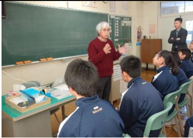
浦島先生(豊頃町)を招いて 道徳の授業