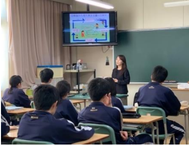
租税教室 社会 税の仕組みについて 税理士からの説明