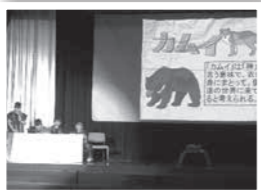
清水小学校 6年生最後の学習発表会