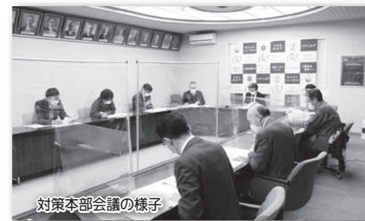
対策本部会議の様子