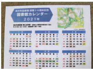
絵本の原画が「図書館カレンダー 2021年」に採用。現在、図書館窓口で配付中です！