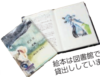
絵本は図書館で貸出ししています！

だのは、一般的に『乳牛』と聞いたとき、牛乳等を生産するために飼育される必要不可欠な経済動物と思うかもしれませんが、酪農を経験した私にとっての『乳牛』は、今も含めて長い間、