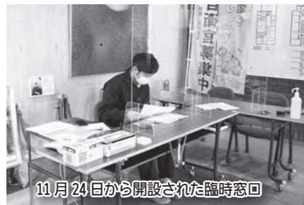
11月24日から開設された臨時窓口

庁舎2階、3階職員 のPCR検査を実施 し、24日以降の役場 庁舎1階の業務は陰 性が確認された職員 が代行する臨時窓口 を開設しました。 翌日以降の患者数・ 対応経過は下記のと おりです。