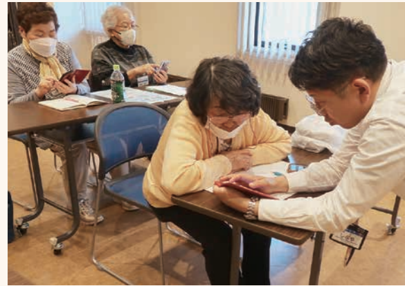
社会教育課社会教育係 ☎ 62・5115

4月21日、しみず学園開講式が開催されました。しみず学園は毎月1回開催し、午前中は知識・教養を高める学習会、午後はクラブ活動に取り組んでいます。今年度からスマホクラブを開設しました。60歳以上の町民であればどなたでも参加できますので、社会教育課までお気軽にお問い合わせください。