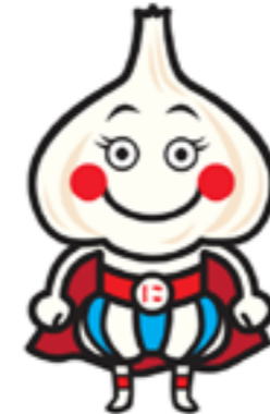
しみずガーリック王子