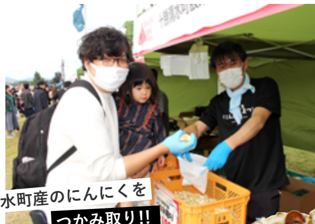
清水町産のんにくを つかみ取り!!

素材の味をそのまま食べられる「にんにく丸ごと素揚げ」や、にんにくがたっぷり入った「ガーリックピザ」など、にんにくの創作料理が勢ぞろい。にんにくのつかみ取りでは、片手いっぱい、にんにくをつかんだお客さんたちがみんな笑顔になっていました。