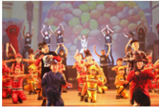
映画をモチーフにしたダンスステージ