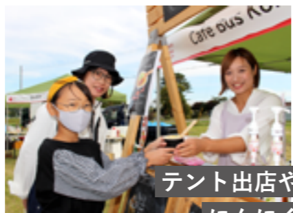
にんにく 丸ごと素揚げ テント出店やキッチンカーなど にんにく料理が勢ぞろい♪