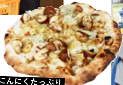
にんにくたっぷり ガーリックピザ

素材の味をそのまま食べられる「にんにく丸ごと素揚げ」や、にんにくがたっぷり入った「ガーリックピザ」など、にんにくの創作料理が勢ぞろい。にんにくのつかみ取りでは、片手いっぱい、にんにくをつかんだお客さんたちがみんな笑顔になっていました。