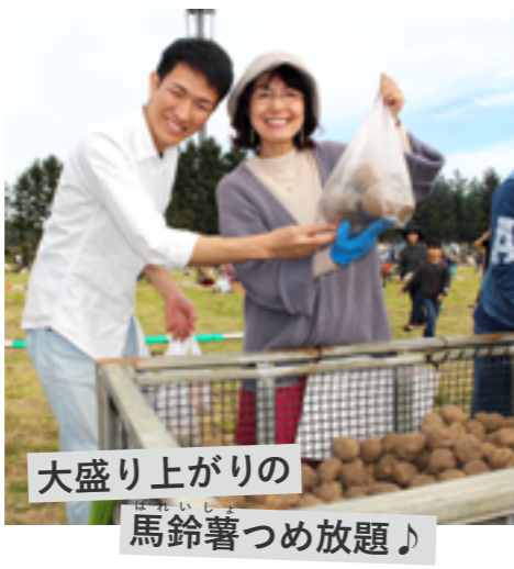
大盛り上がりの 馬鈴薯つめ放題♪

にんにく料理の出店のほかにもイベントが盛りだくさん。子ども向けイベントでは、消防車やパトカーなどの試乗体験が行われました。野菜販売会では、馬鈴薯、白菜、ブロッコリー、長ネギ、小豆などの新鮮野菜が数量限定で販売されました。マスコットキャラクター「しみずガーリック王子」も登場し、大人にも子どもにも大人気の様子でした。