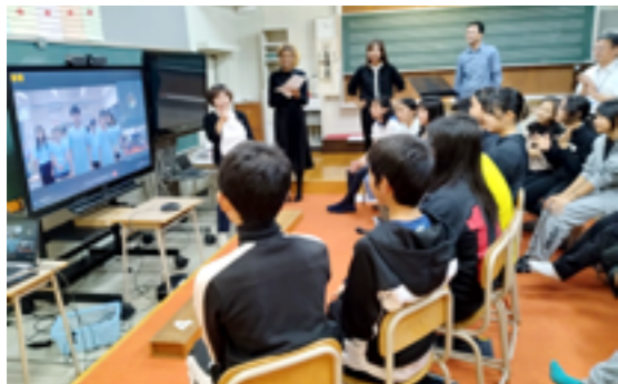
台中市清水国小学校和オンライン交流(御影小学校)

6年生は12月にもう一度交流します。今年 から、中学2年生も台中市の中学生と交流し ます。ぜひ、国際交流を通して視野を広げて ほしいと思います。