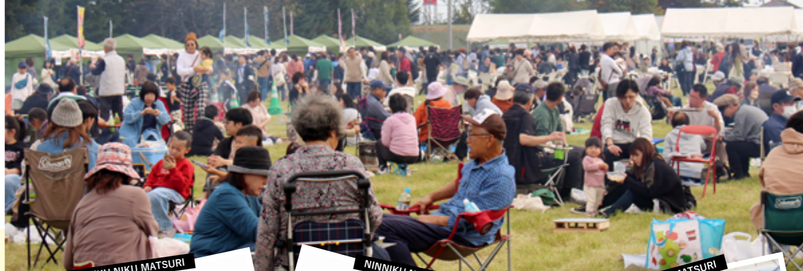
NINNIKU NIKU MATSURI