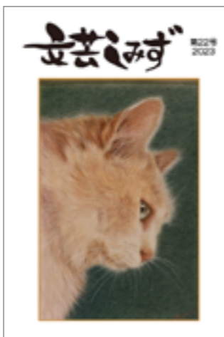
【販売の問い合わせ】 社会教育課 ☎62-5115

町教育委員会では、町民や町にゆかりのある人に文芸作品を寄 稿していただき、年に1度、文芸誌として発刊しています。