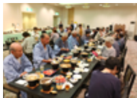
7月修学旅行での交流会