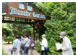
9月バス学習は真鍋庭園へ