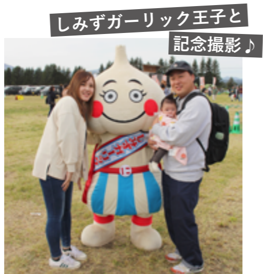
しみずガーリック王子と 記念撮影♪

にんにく料理の出店のほかにもイベントが盛りだくさん。子ども向けイベントでは、消防車やパトカーなどの試乗体験が行われました。野菜販売会では、馬鈴薯、白菜、ブロッコリー、長ネギ、小豆などの新鮮野菜が数量限定で販売されました。マスコットキャラクター「しみずガーリック王子」も登場し、大人にも子どもにも大人気の様子でした。