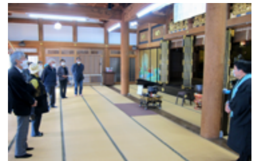
文化史跡めぐり「青淵山寿光寺」