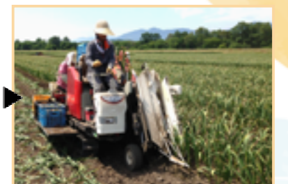
6月下旬以降に収穫