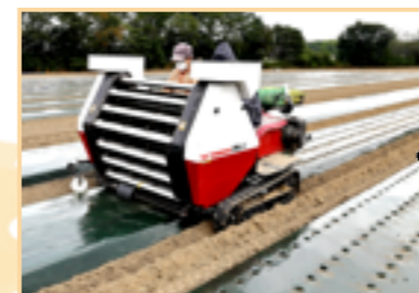
9月上旬頃に植え付け