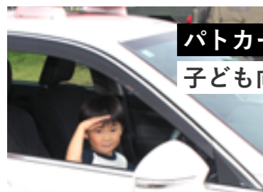
パトカーや消防車の 子ども向け体験も大人気!

当日は、大勢の人が会場を訪れ、種類豊富なにんにく料理や十勝若牛のパーベキューを堪能。にんにく産地として、大いに盛り上がった「にんにく肉まつり」となりました。