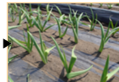
翌年4月頃からすくすく成長