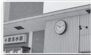
▲止まったままの駅の時計