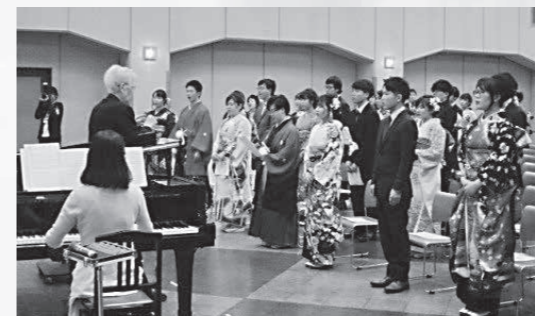
「歓喜の歌」をせせらぎ合唱団とともに合唱