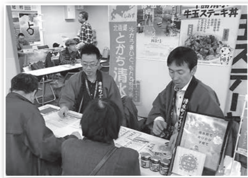
▶北海道暮らしフェアで町の 魅力をPR (東京・大阪)

課題を把握し、官・民がタツ グを組んで取り組んでいか なければいけません。 小さな町なので移住して きた人・そうでない人に関 わらず、これからも地域の サポートを惜しまず、困っ ていることには手伝い、改 善策などを提案していま す。そんな相手の立場に立 てる意識を、町全体で持つ ことができれば、自然と人々 をひきつけられる魅力的な 町になれると思います。