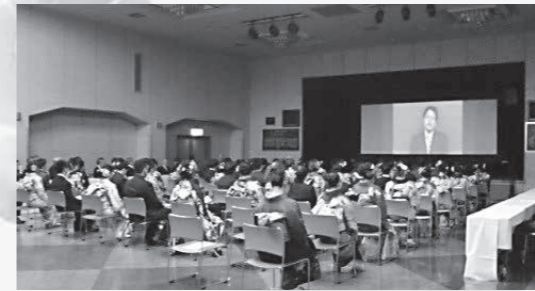
恩師からの励ましのメッセージ上映