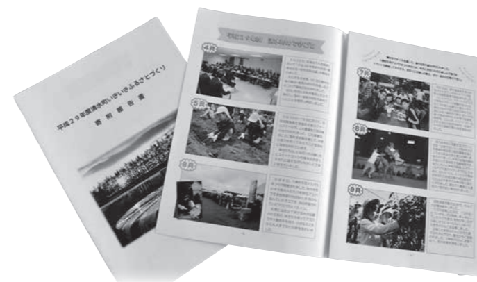
▲移住への思いを強くしたふるさと納税寄附報告書

国土交通省は、平成29年度 国土交通白書で『三大都市圏 の若者は地方移住に強い関心 を持っている』と、発表しま した。求めているのは『のん びり田舎暮らし』ではなく『新 たな暮らしと仕事』。 首都圏で開催している北海 道暮らしフェアなどでは、具 体的な移住希望先を決めず に、「北海道のどこか」への移 住を求めて相談に来る人が多 くいます。まずは、移住する 人たちが「気軽に住める場所」 としての受け入れ態勢が重要 なのかもしれません。 本町では、行政と建設業協 会が一体となって家探しなど の相談に応じています。町が 行政サービスの説明などを、 建設業協会が役場では対応で きないきめ細やかな様々なサ ポートを展開しています。 町の魅力はもちろんです が、事前に気候や環境、住ま い、子育て環境、交通の便な ど、生活に直結することもお 伝えしています。