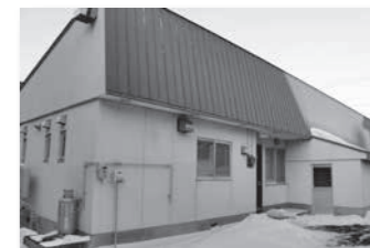
移住体験用住宅 (桂町)

移住を希望する人でも、いきなり知らない土地に住むのは不安になるものです。イメージがわかず「お試しで住んでみたい」という人や、何度も現地を訪れてから移住を決める人もいるのも当然のことです。 町では移住・定住促進対策のひとつとして、道外などから「移住を希望する人」に、1週間から1か月間の間、体験住宅に滞在してもらい、清水の暮らしを体験してもらっています。実際に生活をしながら、観光や地域住民との交流などを通して、リアルな「清水」を肌で感じ、移住後の暮らしをイメージしてもらっています。