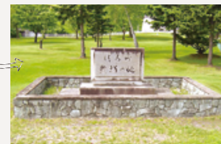
▲駅通跡（町体育館敷地内／字清水第4線 57番地）