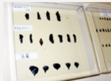
▲ 出土したナイフ類