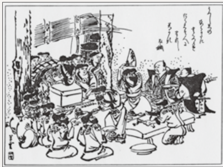
▲ アラクウク家にて (清水町百年史より)