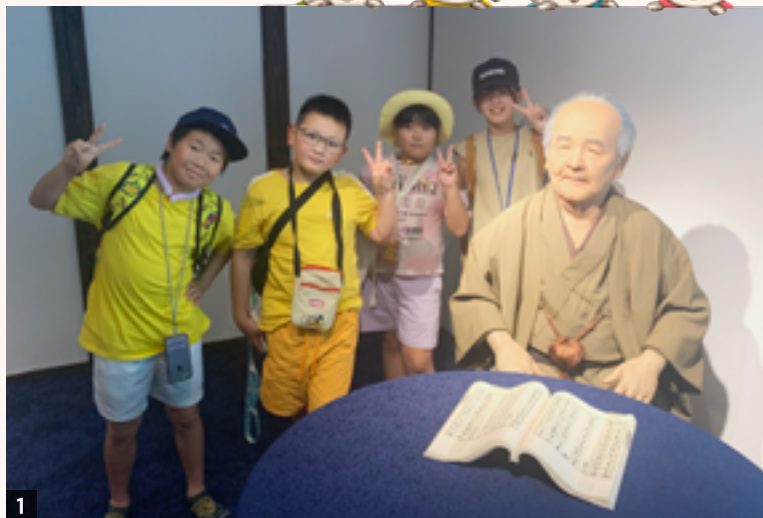
1_ 旧渋沢邸「中の家」で渋沢栄一翁アンドロイドと記念撮影 2_ 八基小学校のみなさんに特製パネルでお出迎えいただきました 3_ 交流では清水町がどんな町なのかを発表してきました 4_ 同小学校のみなさんと一緒に、栄一翁生家の家業にちなんだ「藍のたたき染め」体験を行いました。自分たちの手で摘んだ藍の葉を使って、オリジナルトートバッグを作成しました