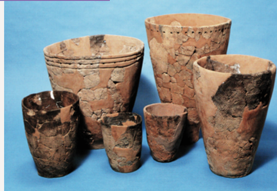
▲ 上清水2遺跡・東松沢2遺跡から出土し、復元された土器類