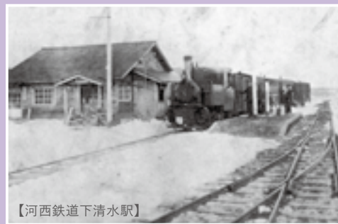
【河西鉄道下清水駅】

※10月7日(土)までに図書館(☎62-3030)へ電話または図書館ホームページ申し込みフォームからご応募ください。