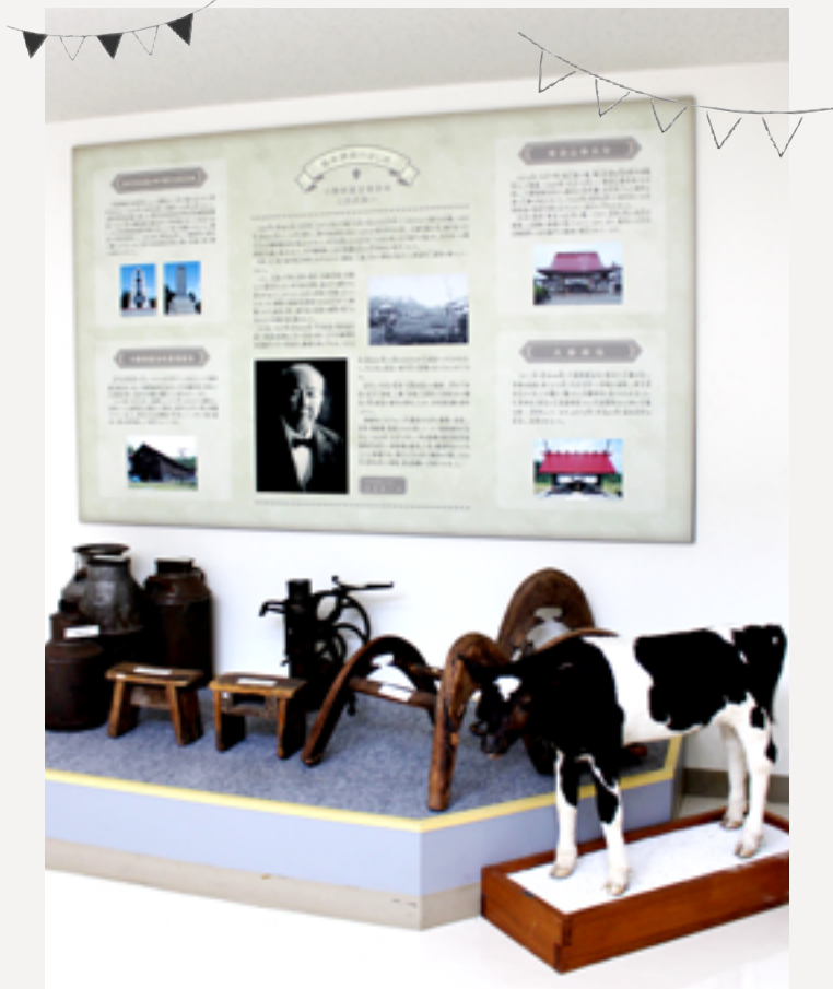
▲開町120年記念ゾーンの渋沢栄一関連コーナー