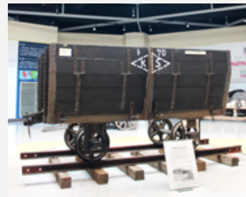
▲河西鉄道のビート貨車模型