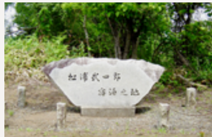
▲ 松浦武四郎 宿泊の地 (字人舞 278 番地)