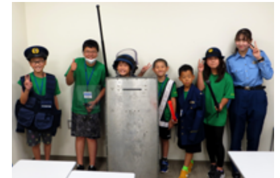
帯広警察署を見学する清水交通少年団のみなさん