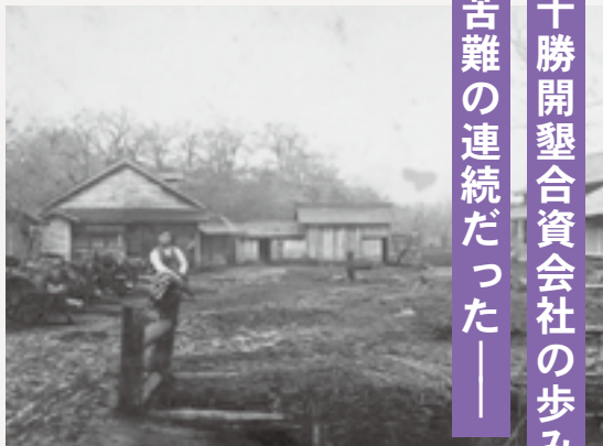
▲ 十勝開墾合資会社熊牛農場事務所

渋沢栄一が携わった十勝開墾合資会社は明治31年 (1898年) に設立し、熊牛に農場事務所を開設しました。同社は小作移民を募集し、石川県や福井県出身の26戸99人が熊牛の開拓に挑みますが、その歩みは苦難の連続でした。十勝内陸部の交通が不便で利益よりも物資の運送料が上回る状況が続く、未開の地に定着する小作人も少ない状態でした。それでも諦めずに出