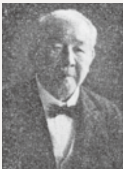
▲ 渋沢栄一