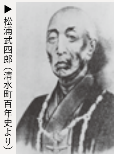
▶ 松浦武四郎 (清水町百年史より)