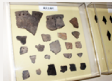
▲ 縄文土器片類 (清水町郷土史料館より)