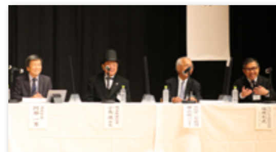
▲ 開町120年記念シンポジウムの様子