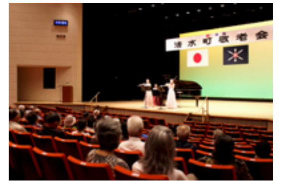
アンサンブルグループ奏楽による演奏

9月1日に、令和5年度清水町敬老会が町文化センターで開催されました。式典には163名のみなさんが出席し、長寿者の紹介などが行われました。今年度の百寿者は5名、白寿者は8名、米寿者は76名、喜寿者は143名でした。また、余興としてアンサンブルグループ奏楽による演奏が行われ、演奏後には出席したみなさんから大きな拍手が送られました。