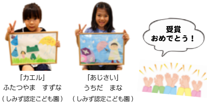
【カエル】 ふうたつやま すずな (しみず認定こども園) 【あじさい】 うちだ まな (しみず認定こども園)