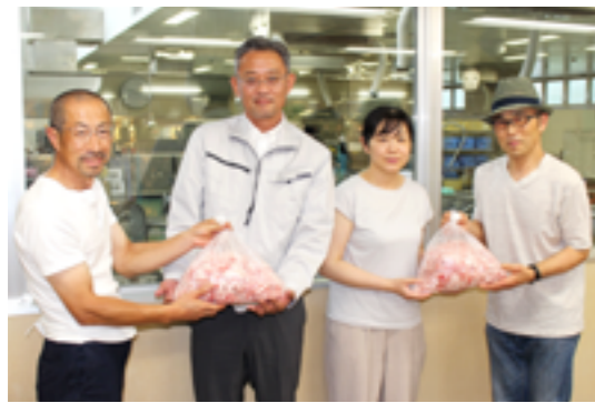
清水町養豚振興会のみなさんと給食センター職員