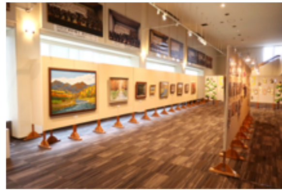
町民絵画展の様子

新着図書などの情報は、図書館ホームページからご覧になれます！左のQRコードまたは「十勝 清水図書館」で検索してください！