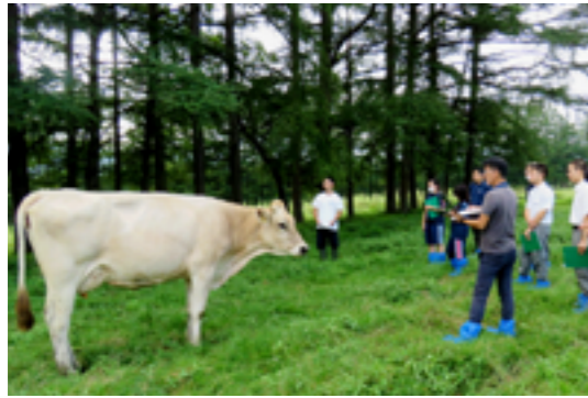
橋本牧場での放牧酪農見学の様子