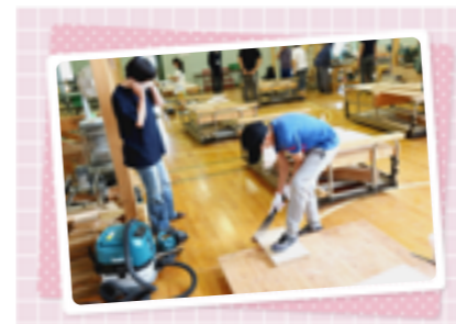
わくわく親子体験講座『親子木工教室』