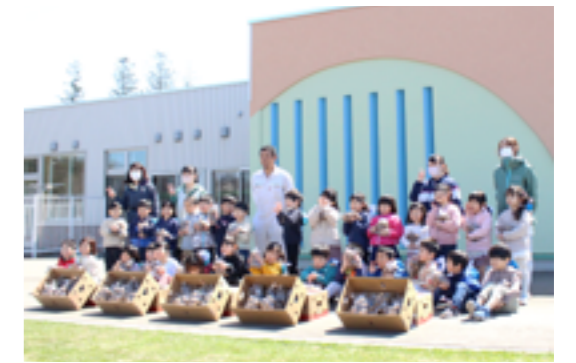
しみず認定こども園への無償提供の様子