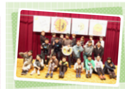
『キッズデイキャンプ』