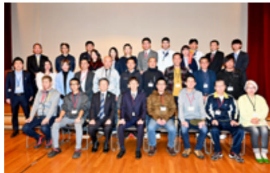
清水町移住促進協議会のメンバー

報告と5年度の事業として首都圏での移住フェアへの参加や部会交流の推進、さらには協議会のNPO法人化などの事業計画が承認された。その後、移住者を囲んでの交流会が開かれ、タイムリングよくダーツの旅(清水編)のテレビ放送を鑑賞しながら、笑顔があふれ楽しい交流の場となった。