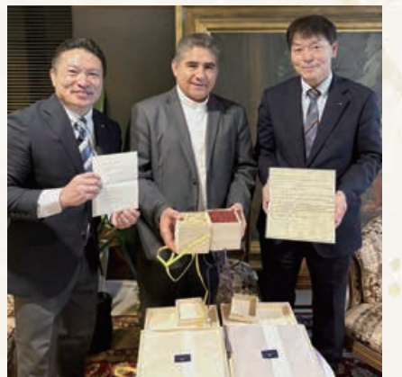
昨年10月ローマ教皇庁大使館を訪問。 清水町産の大豆・小豆を献上しました。

清水町には、全国に誇る一流品が揃っております。昨年10月には、清水町産の大豆と小豆をローマ教皇とダライ・ラマ法王へ献上いたしました。いずれも平和と友好の祈りを込めたものであり、教皇と法王に献上された大豆と小豆として、清水町の産品に新たなストーリーが加わりました。さらに11月には、清水町