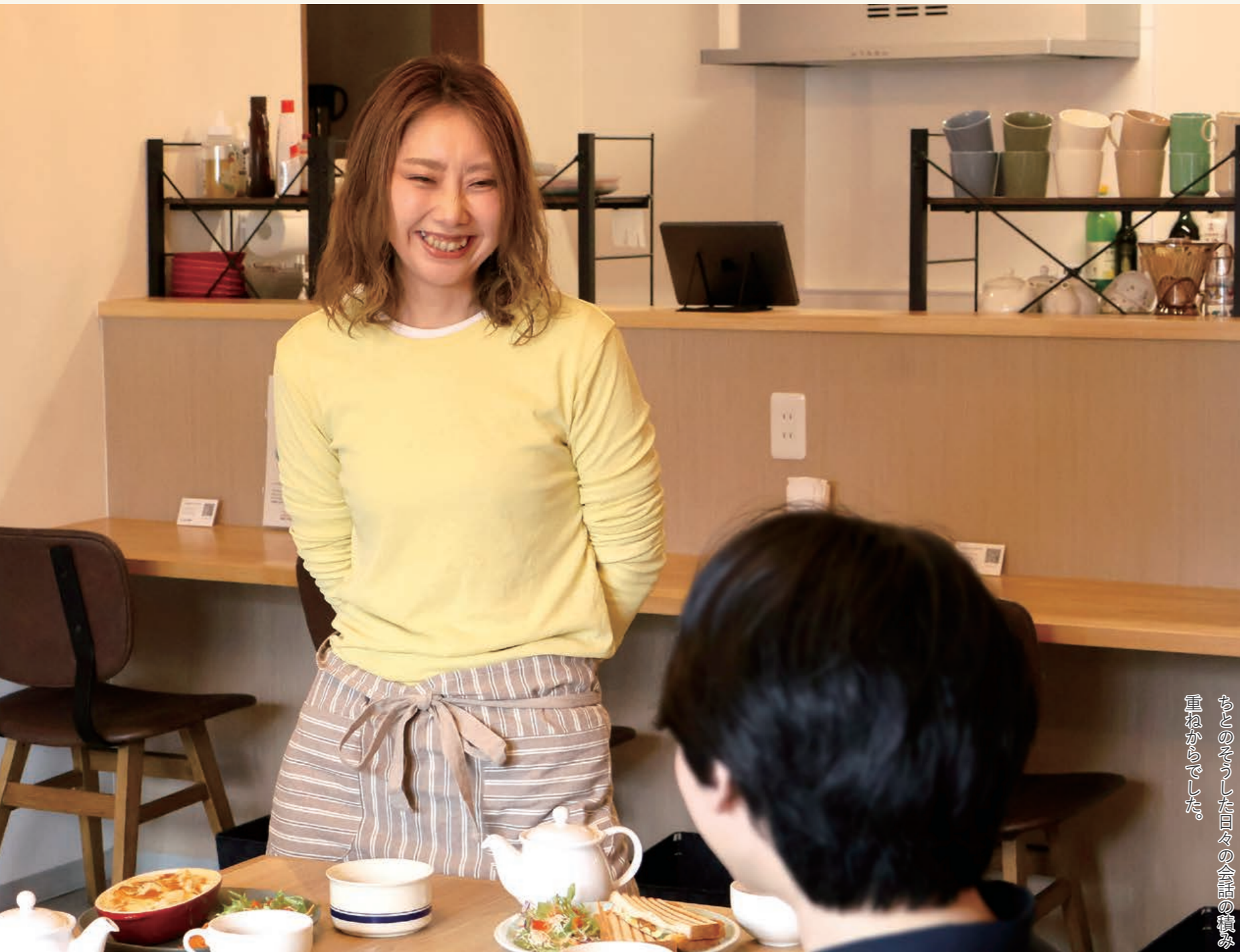
コミュニティカフェ ツナガリウム (住所:清水町本通3丁目2番地 / 電話:070・3623・0683)