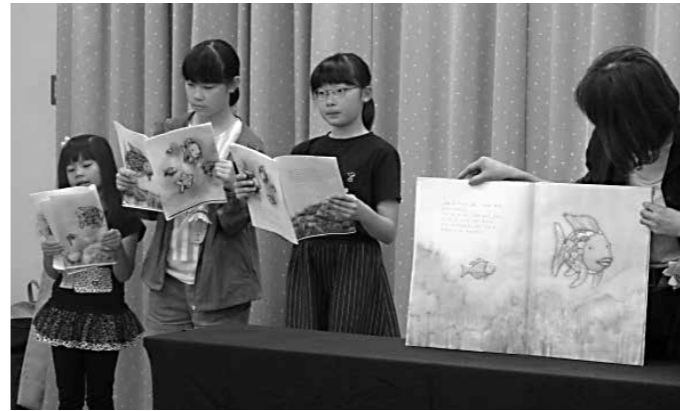
登場人物になりきって読みました