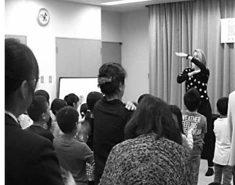
マライア先生とアメリカのダンスに挑戦!