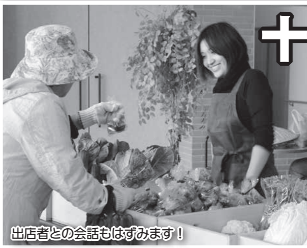
出店者との会話ははずみです!