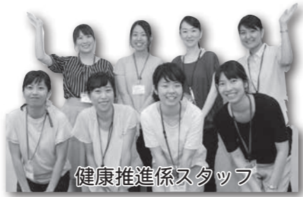
健康推進係スタッフ