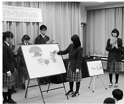
ナレーションとパネルが息の合った動きを見せてくれました