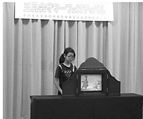
読むのと紙芝居を抜くタイミングを合わせるのを頑張りました