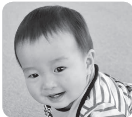
たくさん食べて元気に育ってね!

「HELLO BABY」は、6か月から2歳くらいの赤ちゃんを掲載しています。希望される方は広報広聴係までお気軽にどうぞ。