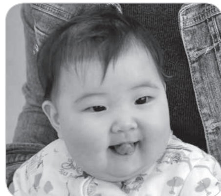
笑顔いっぱい成長してね!