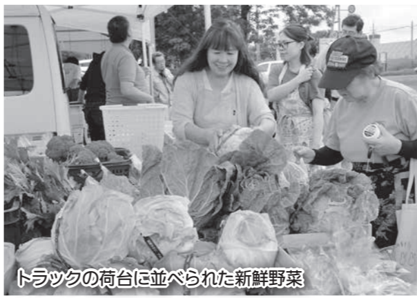
トラックの荷台に並べられた新鮮野菜

町内産の新鮮野菜を町民の皆さんに食べてもらいたいとの思いから始まったトラックマーケットも今年で3年目。 清水地域が7月13日に、御影地域が7月20日にスタート。採れたてのみずみずしい野菜が並べられ、多くの買い物客でにぎわっていました。また、野菜以外にも、お菓子や手作り雑貨なども販売されています。 トラックマーケットは10月中旬頃まで、清水・御影地域でそれぞれ毎月1回程度開かれる予定です。日時・会場は新聞折込みチラシなどで周知されますので、ぜひ一度足を運んでください！ また、出店者も随時募集していますので、町観光協会（事務局 役場商工観光課 ☎62-1156）までお問い合わせください。