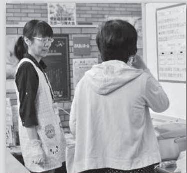
調査にご協力いただいた皆さん、ありがとうございました！