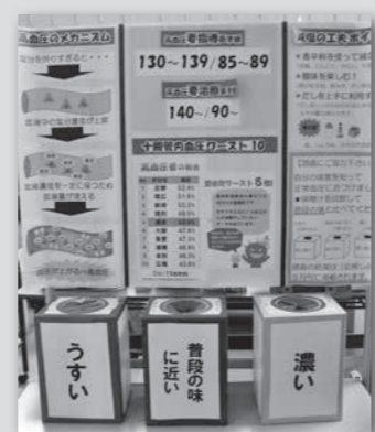
◎みそ汁試飲調査結果 (230人回答)